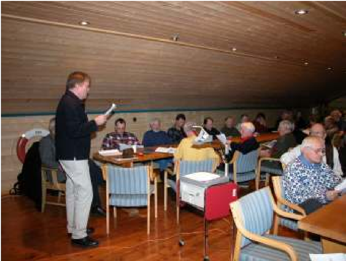
Glimt fra årsmøtet i nye lokaler